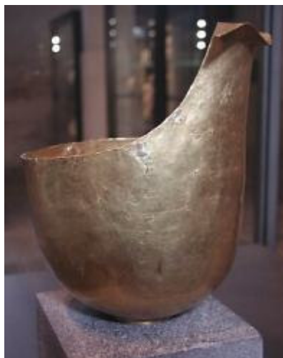
"Molheira" de ouro de Heraia, Arcádia. Data: 2200 a.C. Paris, Musée du Louvre.

Entre 2600 e 2200 a.C., fortificações e grandes edifícios foram erguidos no centro de várias aldeias litorâneas. Eram todos, praticamente, retangulares e com vários cômodos, longos corredores e telhas de terracota. Importantes inovações, como as telhas da Casa das Telhas de Lerna e os tijolos cozidos da Casa Redonda de Tirinto foram usadas na Grécia (e na Europa) pela primeira vez. Datam de 2200-2000 a.C. as primeiras evidências da miscigenação quase sempre pacífica entre os povos já estabelecidos na Grécia e as levas de recém-chegados que chamamos, atualmente, de indo-europeus. A região de onde vieram os indo-europeus é assunto altamente controverso e foge do escopo do presente trabalho.