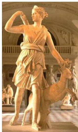
Ártemis caçadora. Cópia romana de original grego do fim do século IV a.C. Paris, Versailles.

Há, na minha opinião, tênues sinais da persistência de tradições paleolíticas e mesolíticas na cultura grega dos Períodos Arcaico e Clássico, notadamente no culto a divindades ligadas à caça e à vida selvagem, como Ártemis, Pã, as ninfas e, em certa medida, a Hélio e a Apolo (8). As tradições míticas que relatam a origem da civilização e de raças, como por exemplo a de Foroneu e a de Pelasgo, são outro exemplo. Foroneu, filho do deus-rio Ínaco e da ninfa Mélia (9), teria sido o primeiro homem do mundo e mais tarde ensinou seus semelhantes a viverem juntos, em comunidade ( Paus. 2.15.5); na Arcádia, dizia-se que Pelasgo, primeiro habitante da região, era filho do solo ( Apollod. 2.1.1).